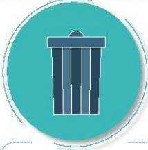
Después de tirar la basura