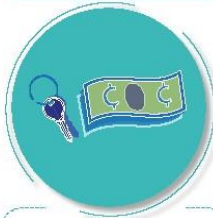
Después de tocar dinero o llaves