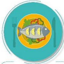
Antes de preparar y comer los alimentos