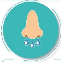
Después de toser o estornudar