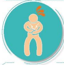
Después de visitar o atender una persona enferma