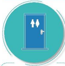
Después de tocar pasamanos o manijas de puertas