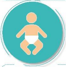
Antes y después de cambiar pañales