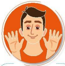
Antes de tocarse la cara