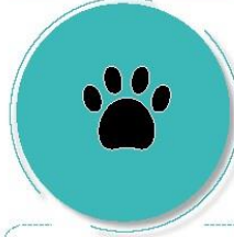
Después de estar con mascotas