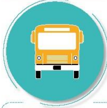
Después de utilizar el transporte público